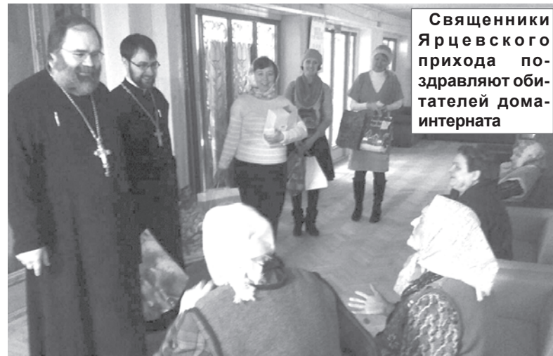
Священники Ярцевского прихода поздравляют обитателей дома-интерната

Сейчас больше всего меня заботит мысль о создании службы добровольцев, как в Смоленске, например. На данный момент у нас только три человека, которые четко выразили желание заниматься волонтерской деятельностью, а именно патронажем, либо оказывать помощь в нашем доме-интернате ("богадельне"). Но для работы там людей недостаточно, поэтому, скорее всего, будем развивать патронаж. Бу-